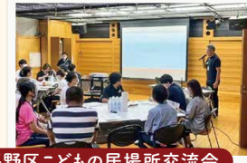
平野区こどもの居場所交流会