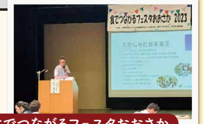
食でつながるフェスタおおさか